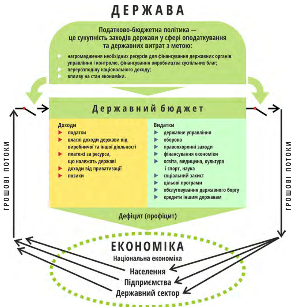
Податково-бюджетна політика держави

Наприклад, одним із критеріїв вступу нових членів до ЄС є показник граничного розміру дефіциту бюджету країни — кандидата на вступ: якщо він вищий за 3 % ВВП, то країну просто не запросять цього року приєднатися до союзу.