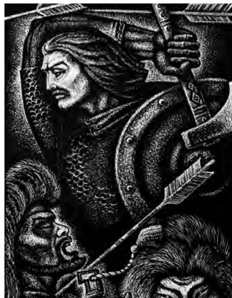
Художник Любомир Прийма. Ілюстрація до твору І. Франка «Захар Беркут», 1985

Голова громади Захар Беркут в кінці звертається до тухольців з такими словами: «Батьки і браття! [...] Ми побідили нашим громадським ладом, нашою згодою і дружністю. Уважайте добре на се! Доки будете жити в громадським порядку, дружно держатися купи, незломно стояти всі за одного, а один за всіх, доти ніяка ворожа сила не побідить вас».