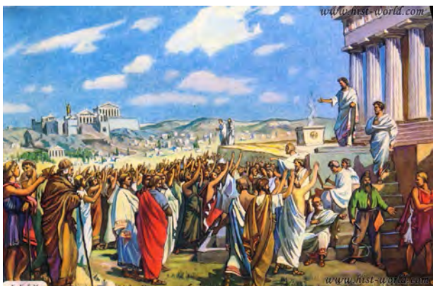
Народні збори в Афінах у V ст. до н.е.

Опираючись на знання, які ви здобули на уроках історії та правознавства, і розглядаючи подані зображення, обговоріть у парах, що для вас означає демократія.