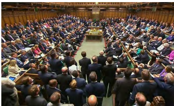
Засідання англійського парламенту в наші дні