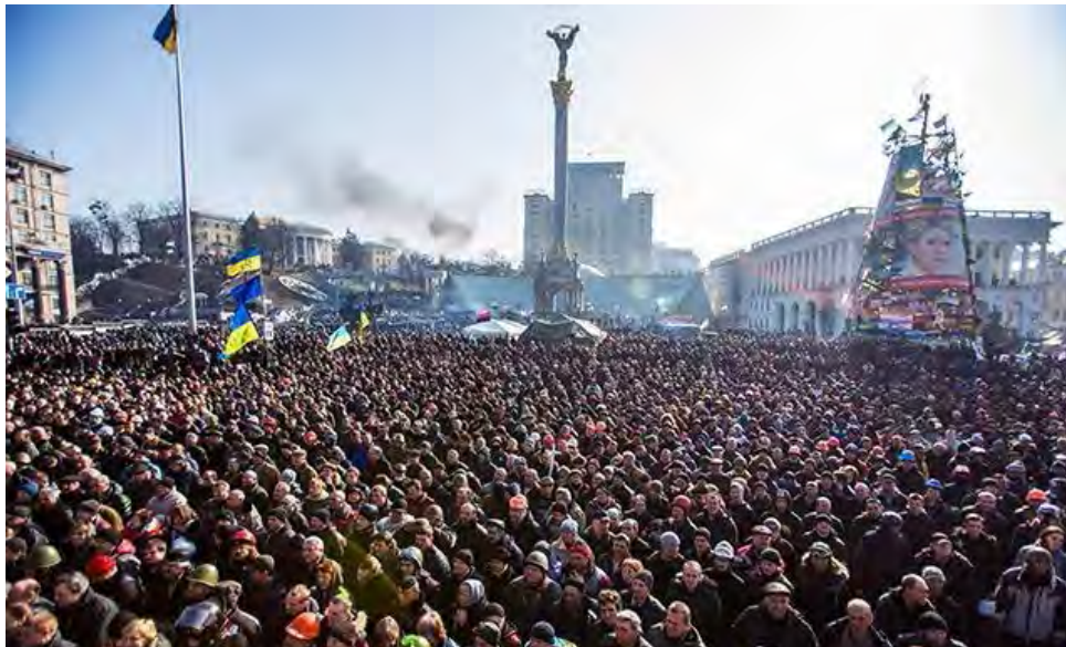
Віче на Майдані Незалежності в Києві, лютий, 2014 р.

■ Представницька демократія — це вираження волі громадян через обраних ними представників до органів державної влади — народних депутатів, Президента, депутатів органів місцевого самоврядування.