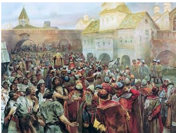
Народне віче часів Київської Русі