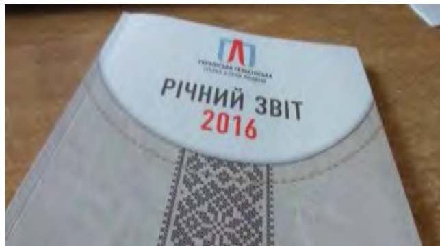
Фото 2. Річний звіт за 2016 рік Української Гельсінської спілки з прав людини