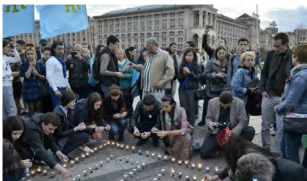
Фото 5. Акція-реквієм «Запали вогник в своєму серці» у Києві 17 травня, присвячена депортації кримськотатарського народу з Кримського півострова