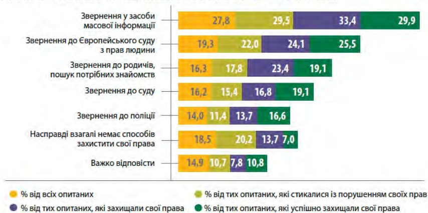
УЯВЛЕННЯ ПРО НАЙЕФЕКТИВНІШІ СПОСОБИ ЗАХИСТУ ПРАВ ЛЮДИНИ В УКРАЇНІ (%) 20