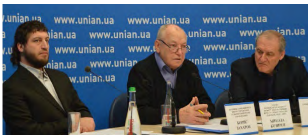
Фото 3. Прес-конференція правозахисників щодо стану з правами людини в Україні у 2017 році.