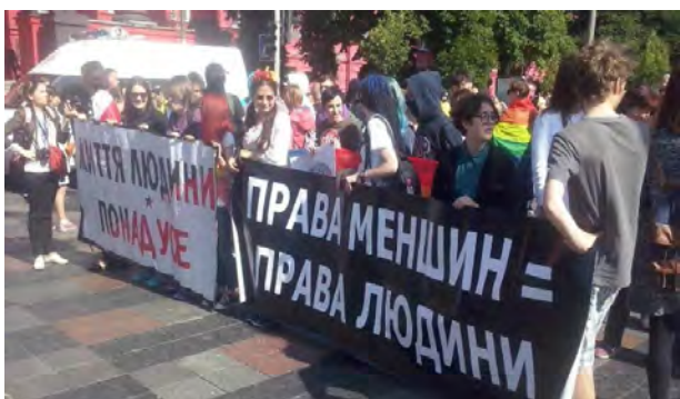
Фото 1. «Марш рівності» в Києві - хода на захист прав людини, зокрема права на мирні зібрання, а також проти дискримінації представників ЛГБТ-спільноти