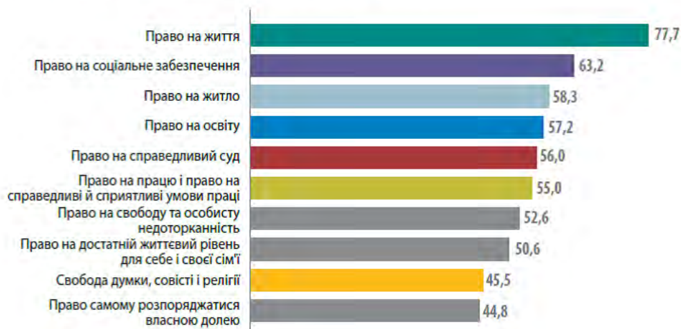
ТОП-10 НАЙВАЖЛИВІШИХ ДЛЯ РЕСПОНДЕНТІВ ПРАВ ЛЮДИНИ (%) 5

(Джерело: Що українці знають і думають про права людини: загальнонаціональне дослідження / [І. Бекешкіна, Т.Печончик, В.Яворський та ін.]; під заг. ред. Т. Печончик. — Київ, 2017. — 308 с.)